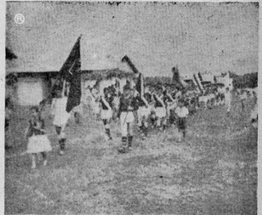
En la gráfica podemos apreciar a los equipos que toman parte en el Campeonato del Ramal La Estrella, momentos en que desfilaban.— (Foto ROJAS).

otros lugares. "El objetivo de la gira es constatar la marcha de los diversos destacamentos de autoridades desperdigados en aquellas extensas zonas. Podemos decir que la labor fue plenamente satisfactoria y que todo se encuentra en orden. Advertimos, que estas inspecciones son efectuadas regularmente".