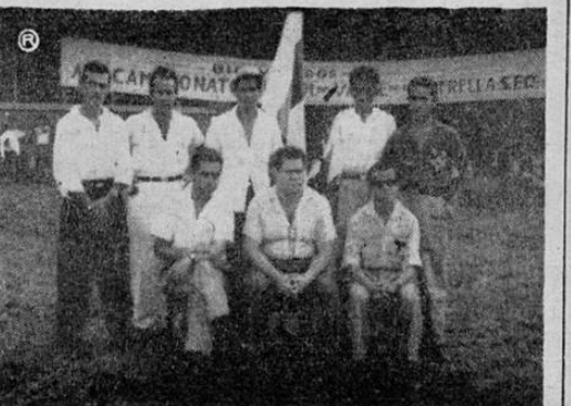
Directivos de la Federación de Limón y miembros organizadores del Campeonato posan especialmente para EL CORREO DEL ATLANTICO.