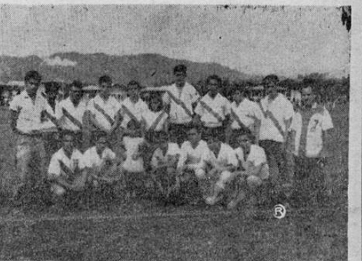
Este es el Deportivo Quirós, que conquistó gallardamente el campeonato del Ramal La Estrella.